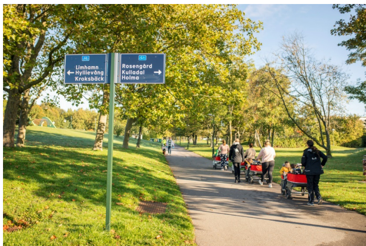
Förskola på promenad i Lindängen.

Vidare lyfts att parkerna är en bra arena för integration. Parken kan ses som en mötesplats för förskolorna inom ett område. På så sätt kan barn från olika förskolor inom området mötas, men även barn från andra områden.