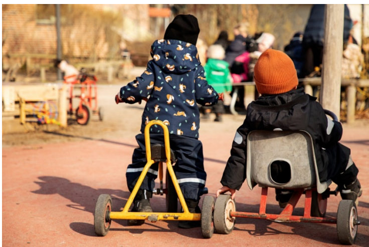
Cyklande barn på Carl Gustavs förskola.

Utformningen av förskolans utemiljö är därmed lika viktig som utformningen av insidan av förskolebyggnaden. Stor del av dagen spenderas ute och gården behöver motsvara barnens behov av att röra sig i varierad terräng, cykla, klättra, leka och utforska inom ramen för ett tryggt, avgränsat men tillräckligt stort område.