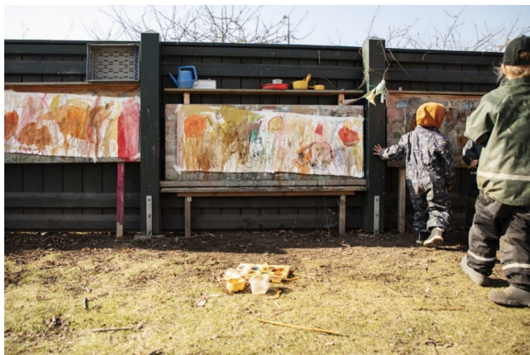
Vattenfärgsmålningar på Carl-Gustavs förskola.

Sammantaget bedömer de intervjuade rektorerna att den egna utemiljöns storlek och utformning är överordnad möjligheten att använda stadens parker.