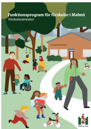
Förskolenämndens funktionsprogram som antogs 2020

Stadsbyggnadskontoret har tagit fram riktlinjer för hur stor den tillgängliga friytan för barnen minst bör vara, för att kunna dimensionera tomter i detaljplaneskedet och senare bedöma bygglovshandlingar. Riktlinjerna innebär i stort att friytan ska finnas på kvartersmark och i direkt anslutning till förskoleverksamhetens lokaler. Det betyder att verksamheten har rådighet över utemiljön, och att den är tillgänglig för förskolan all tid som förskolan önskar. I förskolenämndens funktionsprogram beskrivs de krav som förskoleverksamheten ställer på utformningen av utemiljöer.